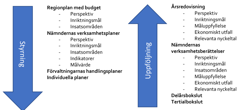
Figur 1. Styrnings- och uppföljningslogik utifrån perspektiv.

Grundat på de verksamhetsberättelser nämnderna har lämnat ska regionstyrelsen till regionfullmäktige göra en årsredovisning för Region Blekinge som helhet. I årsredovisningen redogörs för hur verksamhetens finansiering och den ekonomiska ställningen vid räkenskapsårets slut ser ut. Dessutom ska måluppfyllelsen och relevanta nyckeltal beskrivas och utvärderas.